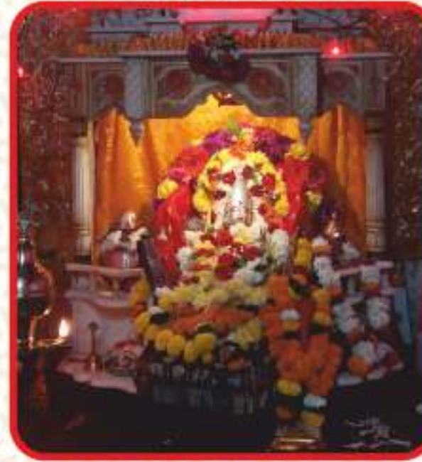
माऊली मंदिर, गावठणवाडी