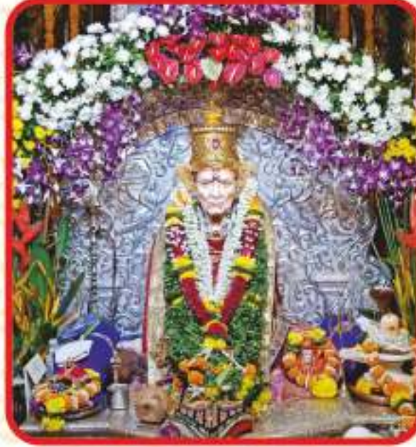
श्री स्वामी समर्थ मठ