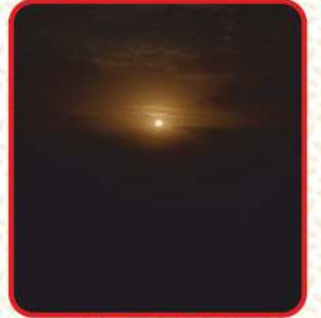
आंबोली सनसेट पॉइंट