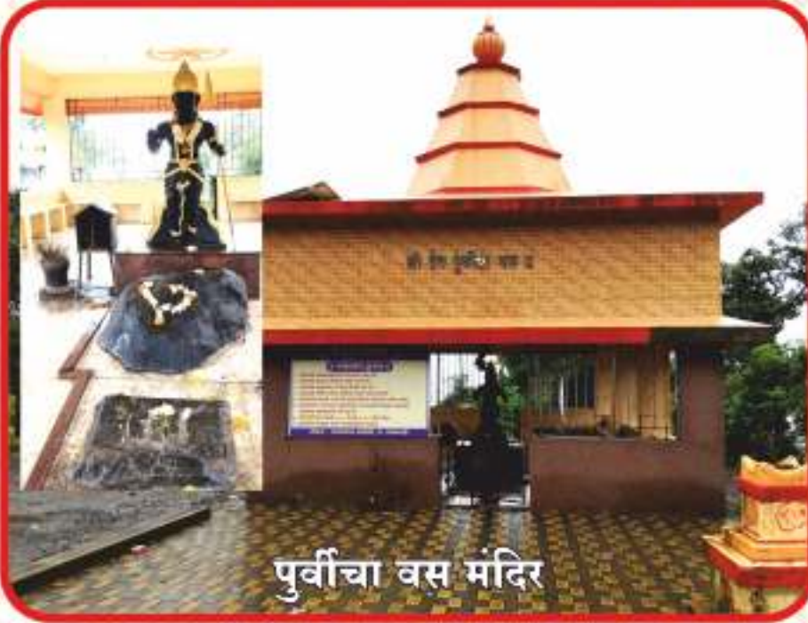
पूर्वीचा वस मंदिर

पूर्वीचा वस मंदिर आंबोली घाटातील महत्वाचे असे हे जागृत देवस्थान आहे. घाटमार्ग बांधण्याआधी येथूनच पायवाटेने पारपोली मार्गे प्रवास केला जात असे. हे जुने आणि ऐतिहासिक असे स्थान आहे. घाटमार्गातून प्रवास करणारे प्रवासी, वाहन चालक व पर्यटक नेहमी दर्शन घेत पुढील प्रवास करतात. तर याच परिसरात आंबोली सनसेट पॉइंट देखील असून सूर्यास्त दर्शन येथून केले जाते.