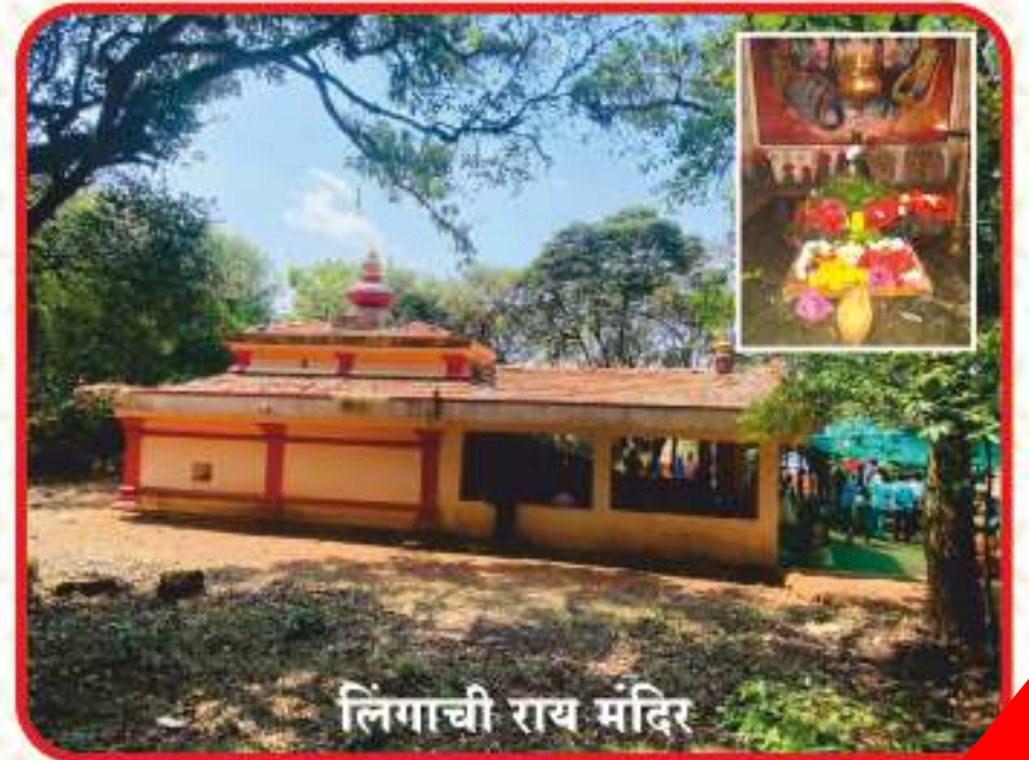
लिंगाची राय मंदिर

जैवविविधतेने परिपूर्ण असा आंबोलीतील पुरातन आणि आध्यात्मकाची अनुभूति देणारा "लिंगदेव राई" असा परिसर आहे. येथे पुरातन महादेवांचे मंदिर असून शिवलिंग, नंदी, श्री गणेश आदी विराजमान आहेत. श्री देवी भावई, श्री देवी सातेरी यांचीही बाजूलाच मंदिरे आहेत. तसेच इतरही देवांची मंदिरे ह्या परिसरात आहेत. हे मंदिर जागृत मंदिर असल्याने दर सोमवारी, श्रावण महीना, महाशिवरात्रि तसेच इतर सनात भाविकांची मोठी गर्दी पाहायला मिळते. तर आंबोलीतील ह्या श्री लिंगदेव राई मध्ये वनौषधींचा जणू खजानाच सापडतो. सोबत दुर्मिळ व अतिदुर्मिळ वन्यजीव यांचाही वास आढळून येतो. असे हे ठिकाण आहे.