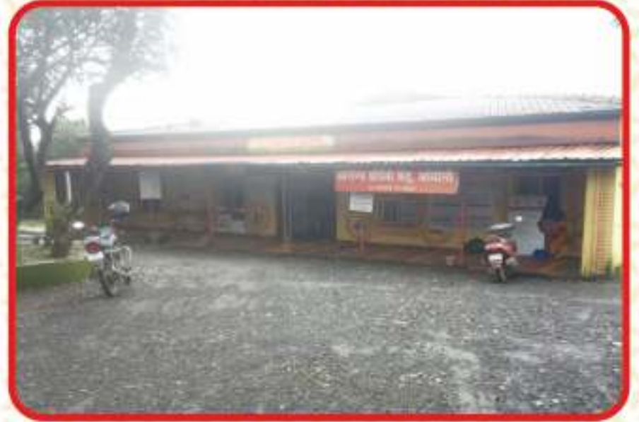
आंबोली प्राथमिक आरोग्य केंद्र