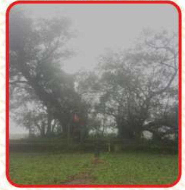
गाव चव्हाटा मंदिर