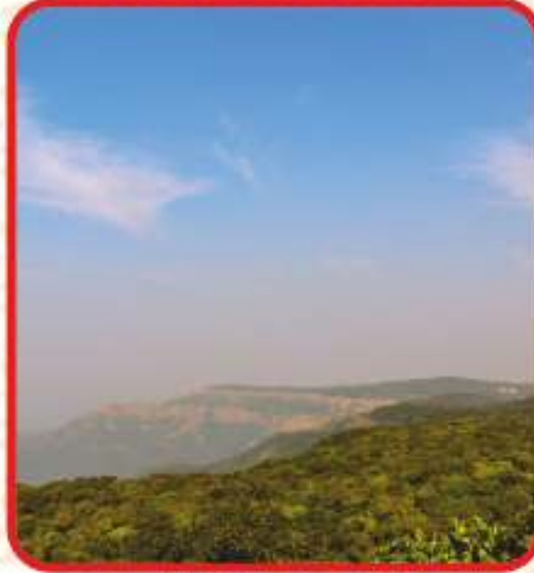
आंबोली व्ह्यु पॉइंट