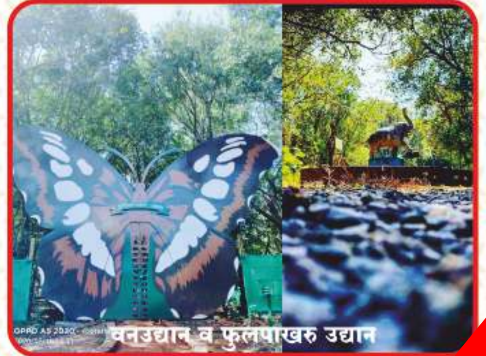
वनउद्यान व फूलपाखरू उद्यान

घाटावर असणारे आंबोली घाटाखालच्या सिंधुदुर्ग जिल्ह्यात कसे ? याचे उत्तर भौगोलीक नसून ऐतिहासिक आहे. सावंतवाडीकर स्थानिकांच्या ताब्यात आंबोली आणि परिसर खूप वर्षांपासून आहे. आंबोली घाटाच्या पायथ्याशी असणारे दाणोली गाव समुद्रसपाटीपासून अवघ्या पाऊणशे मीटर उंचीवर आहे तर पुढच्या फक्त १५ कि. मी. वरचा घाटमाथ्यावरील सूर्यास्त शोभा दाखविणारा भाग तब्बल सव्वासातशे मीटर उंचीवर आहे. या आंबोलीला सावंतवाडीच्या संस्थानिकांचा एक राजेशाही बंगला होता. तिथे उभे राहिल तर सावंतवाडी, कुडाळ अन् फोंडा हा सारा संस्थानी मुलुख नीट न्याहाळता येतो. या बंगल्यातून थेट सावंतवाडीतील राजवाड्याशी संपर्क साधता येई त्यासाठी सूर्यकिरणांचा वापर केला जाई. या यंत्राला हेलिओग्राफ म्हणत हा एक प्रकारचा मोठा आरसाच होता. त्यावर पडणारे सूर्यकिरण सावंतवाडीकडे परावर्तित केले जात असत. आरशावरील झाकणाची विशिष्ट तऱ्हेने उचडझाप केली की तारायंत्रासारख्या कडकट् या मोर्स कोडप्रमाणे एका सांकेतिक संपर्क यंत्रणेमार्फत आपल्याला योग्य तो संपर्क खाली पाठवता येई. सध्या हा बंगला पडक्या अवस्थेत आहे. अन् तो आरसाही अस्तित्वात नाही. ब्रिटिश बांधणीची छाप असणाऱ्या या बंगल्याचे पुनरुज्जीवन झाले तर शाही निवास आजही अनुभवता येईल. तसेच आंबोलीला महाराष्ट्र राज्य पर्यटन महामंडळाचे निवासस्थान आहे. त्या जवळच्या रस्त्यावर दोन थडगी आहेत.