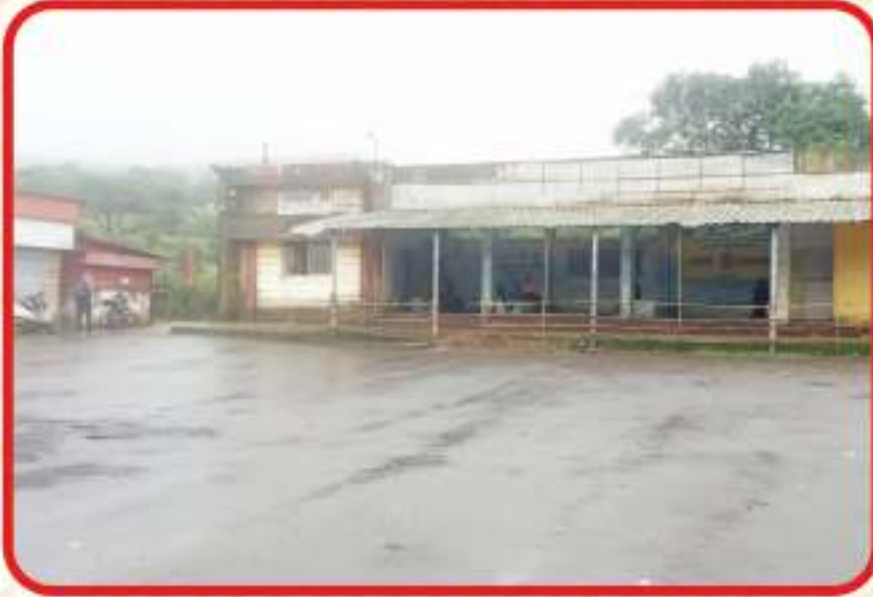
आंबोली मुख्य बस स्टॉप