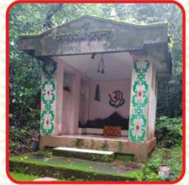
महारवस (दांडेकर मंदिर)