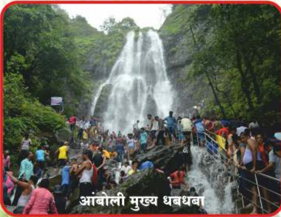
आंबोली मुख्य धबधबा

आंबोली घाटातील वैशिष्टपूर्ण आणि रोमांचित करणारा असा आंबोली मुख्य धबधबा आहे. हाच धबधबा आंबोलीचे अस्तित्व देखील आहे. दरवर्षी मॉनसूनच्या आगमना नंतर पावसाळ्यात आंबोली मुख्य धबधबा प्रवाहीत झाल्यावरच आंबोली वर्षा पर्यटनाला खऱ्या अर्थाने सुरुवात होते. त्यानंतर लाखो पर्यटक ह्या आंबोली धबधब्याला भेट देतात. या धबधब्याची क्रेझ लहान-थोरांसह सर्वांनाच असते. तर आंबोली धबधबा एकमेव सुरक्षित समजला जाणारा धबधबा अशी ओळख आहे. हा धबधबा पावसाळ्यात पाहणे देखील डोळ्यांचे जणू पारणे फेडणारे असते. तर आंबोली मुख्य धबधबा हा उंच डोंगर कड्यावरून पांढऱ्याशुभ्र असा फेसाळत कोसळतो. तर ह्या धबधब्यावर भिजण्यासाठी जाण्याकरिता पायऱ्या आहेत. पावसाळ्यात दरदिवशी हजारो पर्यटक या धबधब्याला भेट देतात. तर सुट्टी दिवशी लाखो पर्यटक एकाच वेळी येथे गर्दी करतात. आणि आंबोली वर्षा पर्यटनाचा मनमुराद आनंद हे पर्यटक घेतात.