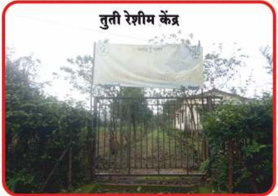
तुती रेशीम केंद्र

आंबोली व सुळेरान या ठिकाणी तुतीरेशीम पैदास केंद्र आहे. हे महाराष्ट्र शासनाचे उद्योग आहे. आंबोलीमध्ये अंडी पूज निर्मिती केंद्र आहे. रेशीमसाठी जी अंडी लागतात ती या ठिकाणी तयार केली जातात व महाराष्ट्र - कर्नाटकात शेतकऱ्यांना दिली जातात. आंबोली व सुळेरान या ठिकाणी बरीच तुती लागवड आहे. या ठिकाणी कोष पण तयार करतात ग्रीनीज, रेरींग, फिडींग असे त्यांचे प्रोसेस आहे. मुख्य प्रोसेस म्हणजे अंडी तयार करणे. तयार केलेले कोष बेंगलोर - नागपूरला पाठवितात,