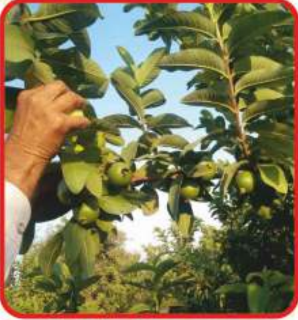
मेनन कंपनी पेरुची बाग (गडदुवाडी)